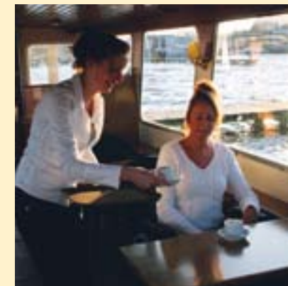
De Zuydtwijck is ook per dag of per week te huur